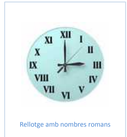
Rellotge amb nombres romans