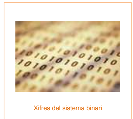
Xifres del sistema binari

El sistema de base 2 o sistema binari també és molt utilitzat hui en dia, sobretot en els ordinadors i calculadores a causa de la seua simplicitat, ja que per a escriure nombres en aquest sistema només es necessiten dos xifres distintes: el 0 i l'1